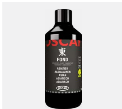
Asiatisk Fond koncentrat 0,98 l flaske til 51 liter Varenr. 296598 EAN 5709347181902