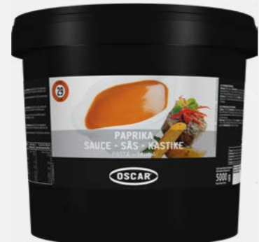
Paprika Sauce pasta 5 kg spand til 29 liter Varenr. 129103 EAN 5709347011124