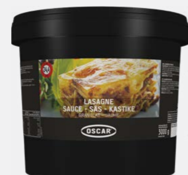
Lasagne Sauce granulat 3 kg spand til 24,4 liter Varenr. 296537 EAN 5709347179619