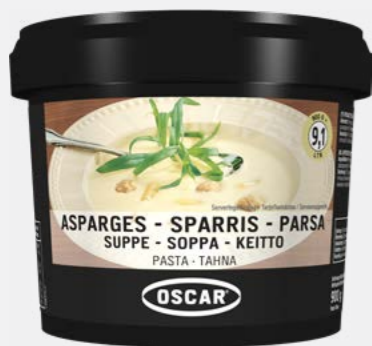
Aspargessuppe pasta 900 g bømte til 9,1 liter Varenr. 296314 EAN 5709347173891