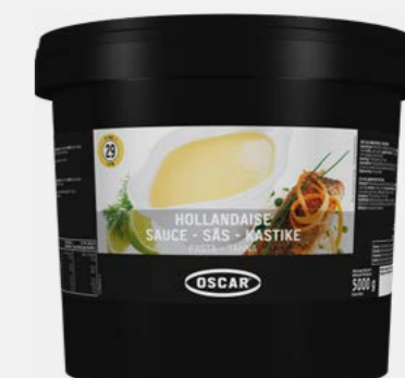
Hollandaise Sauce pasta 5 kg spand til 29 liter Varenr. 296233 EAN 5709347172696