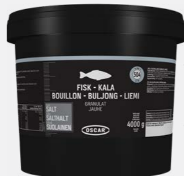
Fiskebouillon granulat Lavsalt 4 kg spand til 504 liter Varenr. 296277 EAN 5709347173303