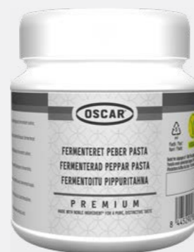
Fermenteret Peber pasta 580 g bømte Varenr. 12562704 EAN 8445290872692