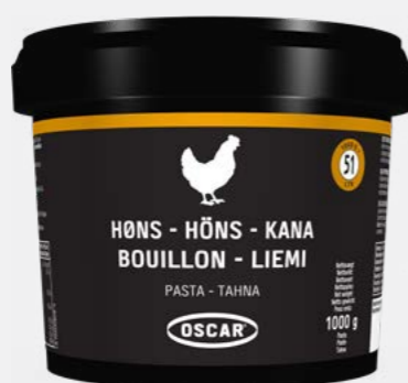
Hønbouillon pasta 1 kg bøtte til 51 liter Varenr. 006102 EAN 5709347010059