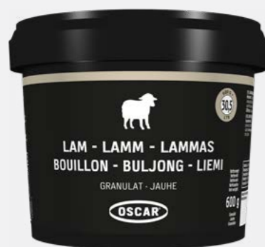
Lammebouillon granulat 600 g bømte til 30,5 liter Varenr. 296503 EAN 5709347179411