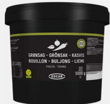
Grønsagsbouillon pasta 5 kg spand til 255 liter Varenr. 003103 EAN 5709347010080