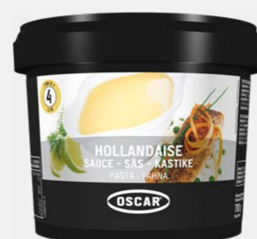
Hollandaise Sauce pasta 700 g bømte til 4 liter Varenr. 296232 EAN 5709347172672