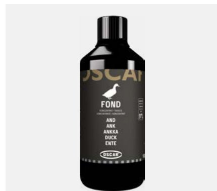
Andefond koncentrat 1 l flaske til 51 liter Varenr. 296520 EAN 5709347179077