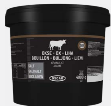
Oksebouillon granulat Lavsalt 4 kg spand til 504 liter Varenr. 296205 EAN 5709347172795