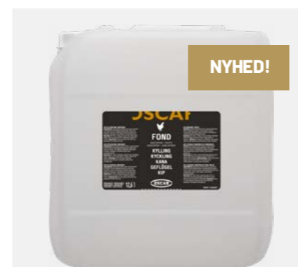
Kyllingefond koncentrat 12,6 l dunk Varenr. 296568 EAN 5709347180257