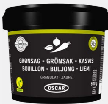
Grønsagsbouillon granulat Halal 600 g bømte til 30,5 liter Varenr. 296510 EAN 5709347179473