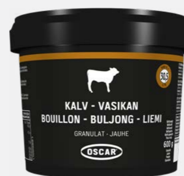
Kalvebouillon granulat 600 g bømte til 30,5 liter Varenr. 015202 EAN 5709347151554