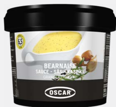
Bearnaise Sauce granulat 500 g bømte til 6,5 liter Varenr. 296434 EAN 5709347177516