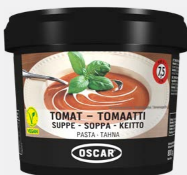
Tomatsuppe pasta 800 g bømte til 7,5 liter Varenr. 296352 EAN 5709347175048