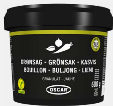
Grønsagsbouillon granulat 600 g bømte til 30,5 liter Varenr. 005102 EAN 5709347011995