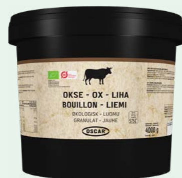
Oksebouillon granulat Økologisk 4 kg spand til 575 liter Varenr. 12503856 EAN 7613287958426