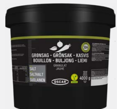
Grønsagsbouillon granulat Lavsalt 4 kg spand til 504 liter Varenr. 296206 EAN 5709347172764