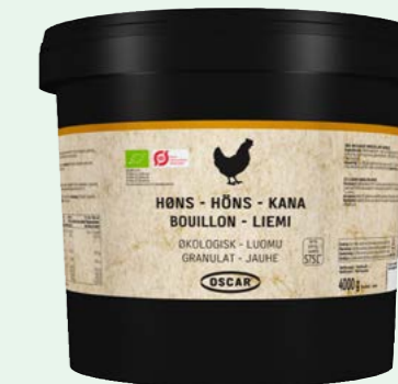
Hønbouillon granulat Økologisk 4 kg spand til 575 liter Varenr. 12503854 EAN 7613287958334