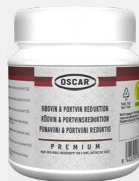
Rødvin & Portvin Reduktion 580 g bømte Varenr. 12562688 EAN 8445290872630