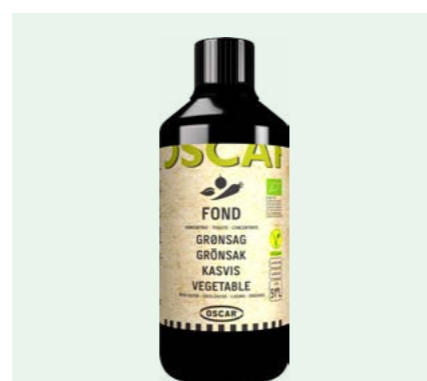
Grønsagsfond koncentrat Økologisk 1 l flaske til 51 liter Varenr. 12503775 EAN 7613287957320