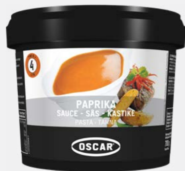
Paprika Sauce pasta 700 g bølge til 4 liter Varenr. 129102 EAN 5709347011117