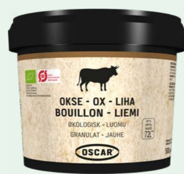
Oksebouillon granulat Økologisk 500 g bømte til 72 liter Varenr. 12503855 EAN 7613287958396