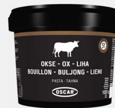
Oksebouillon pasta 1 kg bøtte til 51 liter Varenr. 000102 EAN 5709347010011