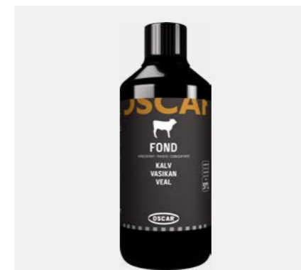
Kalvefond koncentrat 1 l flaske til 51 liter Varenr. 296514 EAN 5709347178957