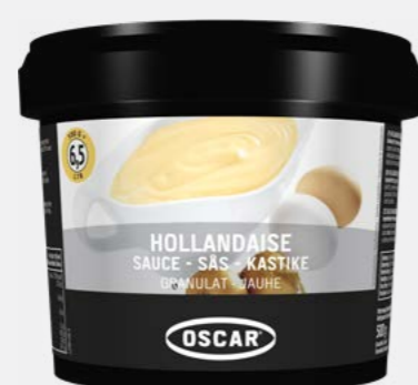
Hollandaise Sauce granulat 500 g bømte til 6,5 liter Varenr. 296438 EAN 5709347177561