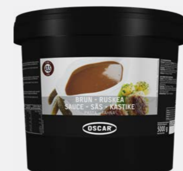
Brun Sauce pasta 5 kg spand til 43,5 liter Varenr. 084103 EAN 5709347010752