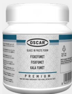
Fiskefumet pasta 630 g bømte Varenr. 12586627 EAN 8445291272347