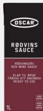
Rødvins Sauce 1 l karton Varenr. 101050 EAN 5709347169740