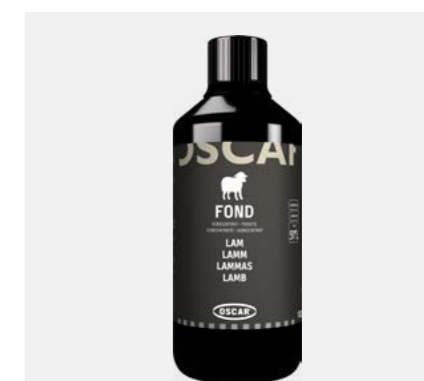
Lammefond koncentrat 1 l flaske til 51 liter Varenr. 296519 EAN 5709347179053