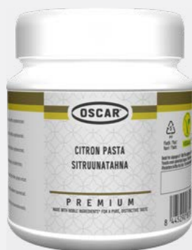
Citron pasta 580 g bømte Varenr. 12562724 EAN 8445290872463