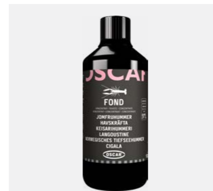
Jomfruhummerfond koncentrat 1 l flaske til 51 liter Varenr. 12495916 EAN 7613287804556