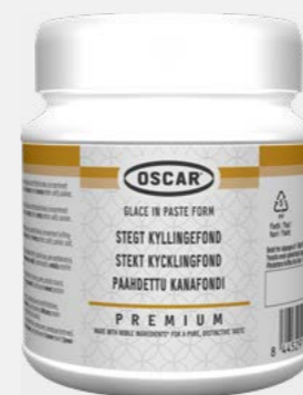
Stegt Kyllingefond pasta 640 g bømte Varenr. 12586636 EAN 8445291271777