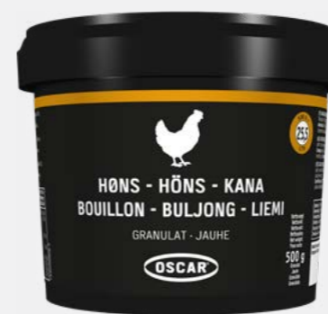
Hønbouillon granulat 500 g bømte til 25,5 liter Varenr. 006902 EAN 5709347011223