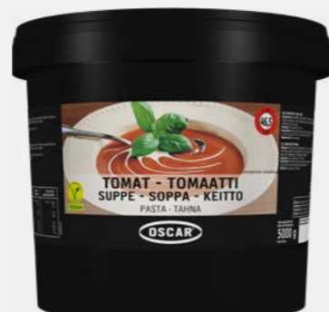
Tomatsuppe pasta 5 kg spand til 46,5 liter Varenr. 296353 EAN 5709347175062