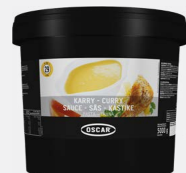
Karry Sauce pasta 5 kg spand til 29 liter Varenr. 296542 EAN 5709347179671