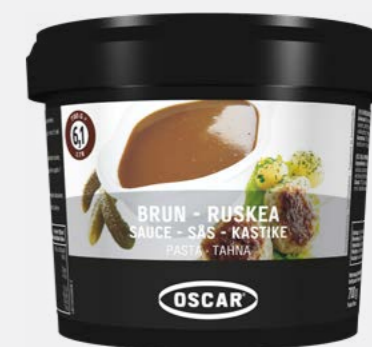
Brun Sauce pasta 700 g bømte til 6,1 liter Varenr. 084102 EAN 5709347010745