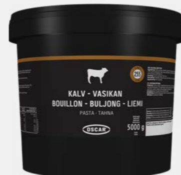
Kalvebouillon pasta 5 kg spand til 255 liter Varenr. 015003 EAN 5709347013043