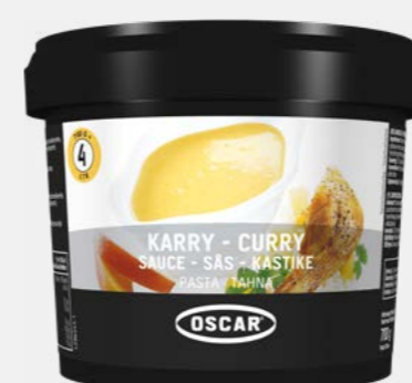
Karry Sauce pasta 700 g bømte til 4 liter Varenr. 296541 EAN 5709347179794