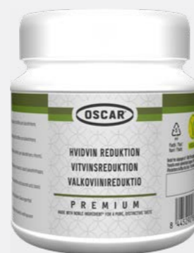
Hvidvin Reduktion 580 g bømte Varenr. 12562687 EAN 8445290872500