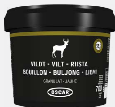
Vildtbouillon granulat 700 g bømte til 35,5 liter Varenr. 12438920 EAN 7613039077993