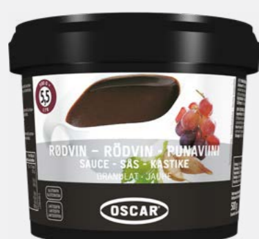
Rödvinns Sauce granulat 500 g bømte til 5,5 liter Varenr. 296440 EAN 5709347177592