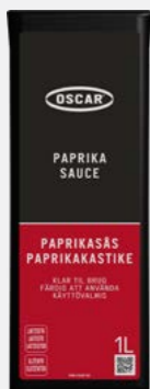
Paprika Sauce 1 l karton Varenr. 12561872 EAN 8445290855152