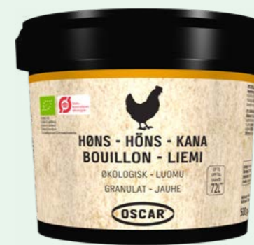
Hønbouillon granulat Økologisk 500 g bømte til 72 liter Varenr. 12503853 EAN 7613287958303