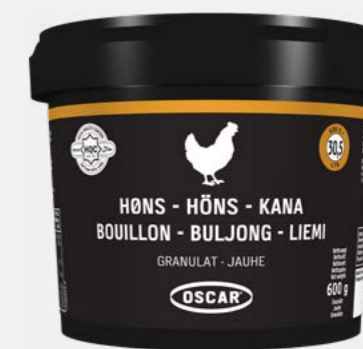
Hønbouillon granulat Halal 600 g bømte til 30,5 liter Varenr. 296043 EAN 5709347170869