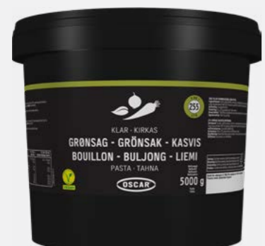
Grønsagsbouillon Klar pasta 5 kg spand til 255 liter Varenr. 003803 EAN 5709347010394