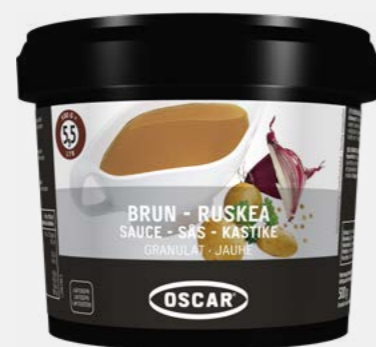
Brun Sauce granulat 500 g bømte til 5,5 liter Varenr. 296436 EAN 5709347177530