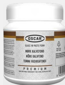
Mørk Kalvefond pasta 600 g bømte Varenr. 12586644 EAN 8445291272125