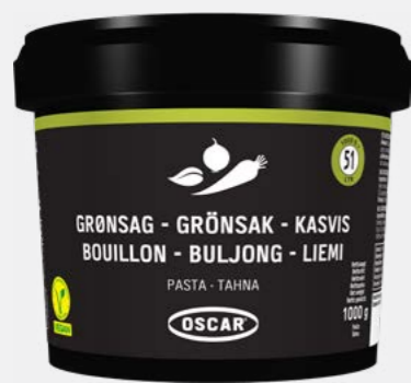
Grønsagsbouillon pasta 1 kg bøtte til 51 liter Varenr. 003102 EAN 5709347010073