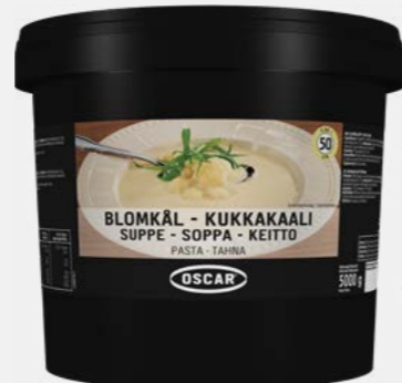
Blomkålssuppe pasta 5 kg spand til 50 liter Varenr. 296310 EAN 5709347173884