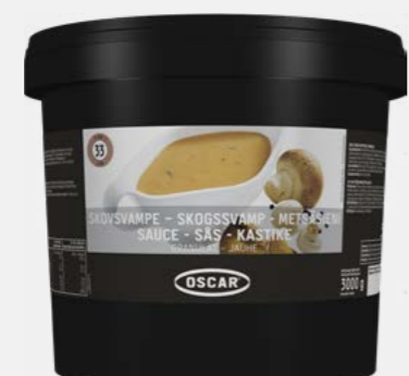
Skovsvampe Sauce granulat 3 kg spand til 34,5 liter Varenr. 296443 EAN 5709347177646