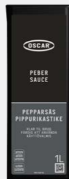
Peber Sauce 1 l karton Varenr. 12575504 EAN 8445291065215