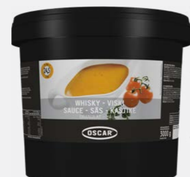
Whisky Sauce granulat 3 kg spand til 24,5 liter Varenr. 296535 EAN 5709347179503