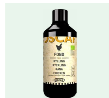
Kyllingefond koncentrat Økologisk 1 l flaske til 51 liter Varenr. 12503757 EAN 7613287957269