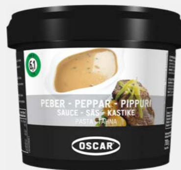
Peber Sauce pasta 700 g bølge til 6,1 liter Varenr. 099102 EAN 5709347010721