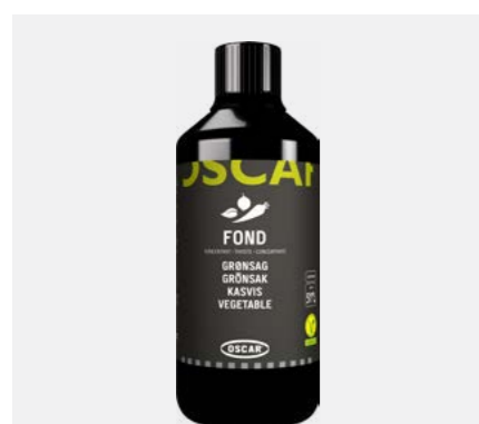
Grønsagsfond koncentrat 1 l flaske til 51 liter Varenr. 296517 EAN 5709347179015