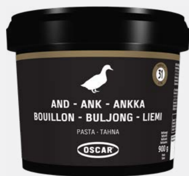
Andebuillon pasta 900 g bøtte til 31 liter Varenr. 018202 EAN 5709347010226