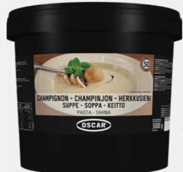
Champignonsuppe pasta 5 kg spand til 50 liter Varenr. 296307 EAN 5709347173839