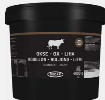
Oksebouillon granulat 4 kg spand til 204 liter Varenr. 001903 EAN 5709347010042