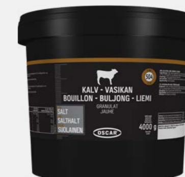
Kalvebouillon granulat Lavsalt 4 kg spand til 504 liter Varenr. 296202 EAN 5709347172788