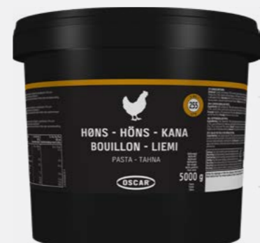
Hønbouillon pasta 5 kg spand til 255 liter Varenr. 006103 EAN 5709347010066