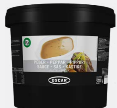
Peber Sauce pasta 5 kg spand til 43,5 liter Varenr. 099103 EAN 5709347010738