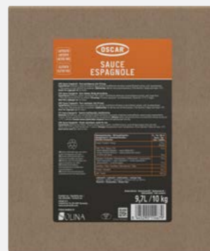
Sauce Espagnole 9,7 l / 10 kg bag in box Varenr. 12511452 EAN 8445290114679