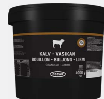
Kalvebouillon granulat 4 kg spand til 204 liter Varenr. 015203 EAN 5709347010271