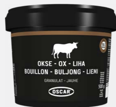
Oksebouillon granulat 500 g bømte til 25,5 liter Varenr. 001902 EAN 5709347010035