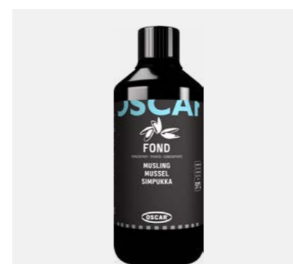
Muslingefond koncentrat 1 l flaske til 51 liter Varenr. 296582 EAN 5709347181308