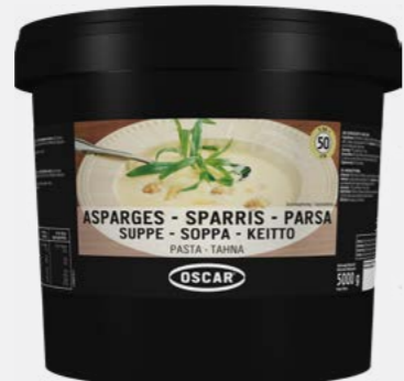
Aspargessuppe pasta 5 kg spand til 50 liter Varenr. 296315 EAN 5709347173914