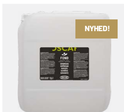
Grønsagsfond koncentrat 12,6 l dunk Varenr. 12581677 EAN 8445291190344