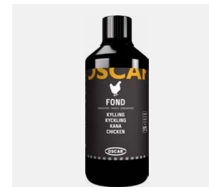
Kyllingefond koncentrat 1 l flaske til 51 liter Varenr. 296516 EAN 5709347178995