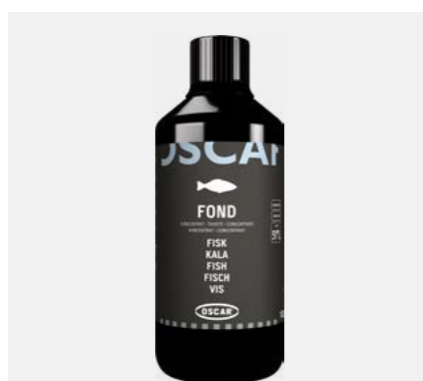
Fiskefond koncentrat 1 l flaske til 51 liter Varenr. 296518 EAN 5709347179039