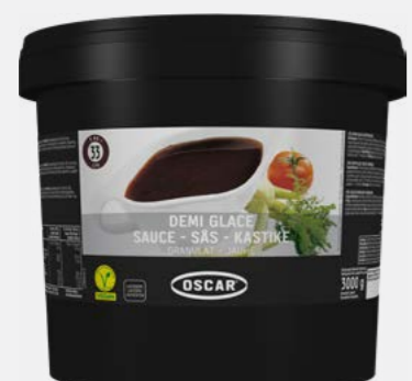
Demi Glace granulat 3 kg spand til 33 liter Varenr. 296342 EAN 5709347174980