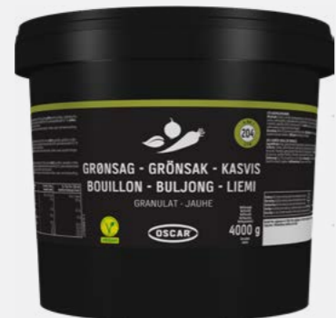
Grønsagsbouillon granulat 4 kg spand til 204 liter Varenr. 005103 EAN 5709347011957