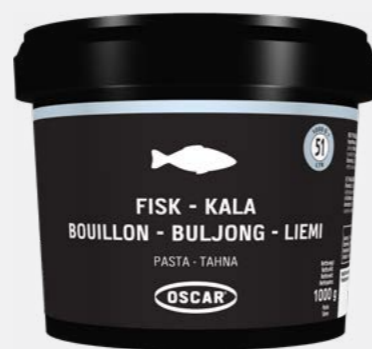
Fiskebouillon pasta 1 kg bøtte til 51 liter Varenr. 009002 EAN 5709347013012