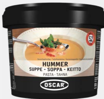
Hummersuppe pasta 800 g bømte til 5,2 liter Varenr. 296543 EAN 5709347179688