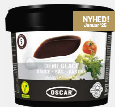
Demi Glace granulat 500 g bømte Varenr. 296639 EAN 5709347184668