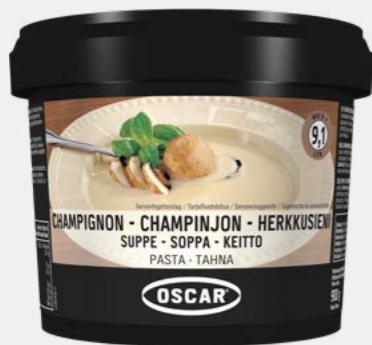
Champignonsuppe pasta 900 g bømte til 9,1 liter Varenr. 296308 EAN 5709347173846