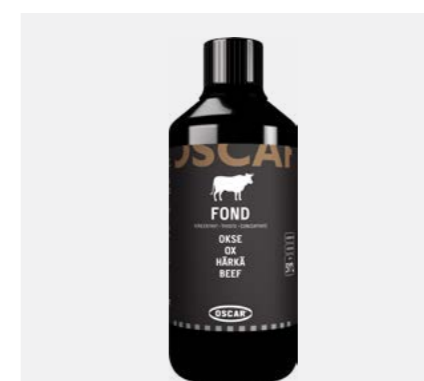
Oksefond koncentrat 1 l flaske til 51 liter Varenr. 296515 EAN 5709347178971