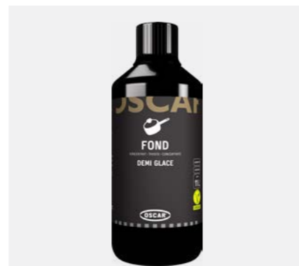
Demi Glace koncentrat 1 l flaske til 11 liter Varenr. 296480 EAN 5709347179145