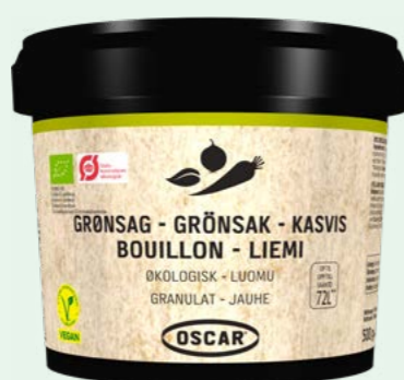
Grønsagsbouillon granulat Økologisk 500 g bømte til 72 liter Varenr. 12503776 EAN 7613287957382