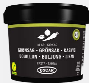
Grønsagsbouillon Klar pasta 800 g bøtte til 41 liter Varenr. 003802 EAN 5709347010387