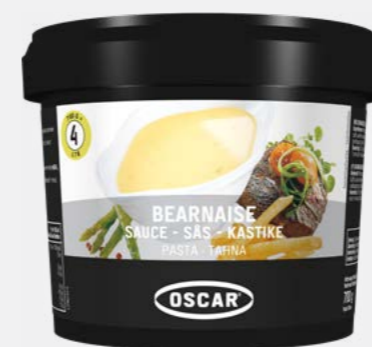
Bearnaise Sauce pasta 700 g bømte til 4 liter Varenr. 296234 EAN 5709347172702