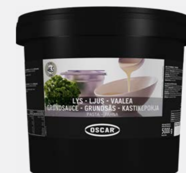
Lys Grundsauce pasta 5 kg spand til 46,5 liter Varenr. 296311 EAN 5709347173716