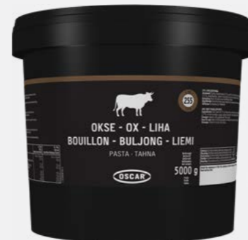
Oksebouillon pasta 5 kg spand til 255 liter Varenr. 000103 EAN 5709347010028