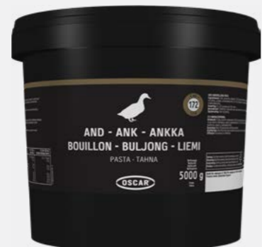
Andebuillon pasta 5 kg spand til 172 liter Varenr. 018203 EAN 5709347010233