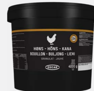
Hønbouillon granulat 4 kg spand til 204 liter Varenr. 006903 EAN 5709347011230