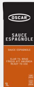
Sauce Espagnole 1 l karton Varenr. 01904 EAN 5709347015085