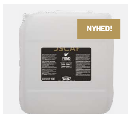
Demi Glace koncentrat 12,6 l dunk Varenr. 12475035 EAN 7613287393333