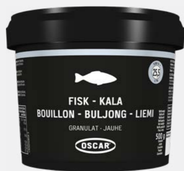
Fiskebouillon granulat 500 g bømte til 25,5 liter Varenr. 009202 EAN 5709347010134