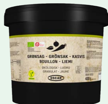
Grønsagsbouillon granulat Økologisk 4 kg spand til 575 liter Varenr. 12503777 EAN 7613287957412