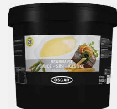
Bearnaise Sauce pasta 5 kg spand til 29 liter Varenr. 296235 EAN 5709347172726