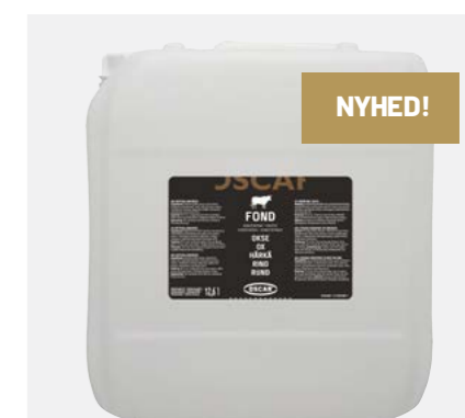
Oksefond koncentrat 12,6 l dunk Varenr. 12581685 EAN 8445291190405