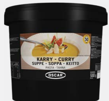
Karrysuppe pasta 5 kg spand til 50 liter Varenr. 296451 EAN 5709347177813