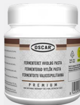
Fermenteret Hvidløg pasta 580 g bømte Varenr. 12562689 EAN 8445290872661