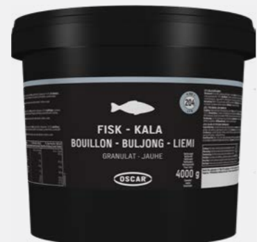
Fiskebouillon granulat 4 kg spand til 204 liter Varenr. 009200 EAN 5709347169542