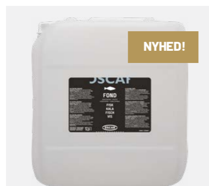
Fiskefond koncentrat 12,6 l dunk Varenr. 296569 EAN 5709347180264